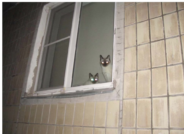
Сіямскія каты: прыкметна адрозненне колеру. Адлюстраванне размыта з-за другаснага адлюстравання на шыбе акна

цыяй вясёлкавай абалонкі. У блакітнавокіх катой (гэтак жа, як і ў сабак), незалежна ад колеру поўсці, тапетум пігментаваны слаба, і іх зрэнка адсвятляюць чырвоным колерам і меней ярка - як у чалавека (tapetum nigrum). Гэта дазваляе выказаць здагадку, што начны зрок блакітнавокіх катой такі ж слабы, як у чалавека. Каціныя нараджаюцца блакітнавокімі, гэта значыць са слаба пігментаванай вясёлкай і, адпаведна, са слаба пігментаваным тапетумам. Прыкладна да 3-месячнага ўзросту, калі ў жаўтавокіх і зялёнавокіх катой вясёлка насычаецца пігментам, пігментуецца і тапетум. Адценне свячэння зрэнак таксама залежыць ад кута падзення святла, бо пігментацыя тапетума змяняецца па кірунку ад задняй сценкі вочнага яблыка да перадняй, і яго адценне змя-