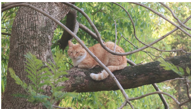
Кот сядзіць на дрэве

За пачуццё раўнавагі ў катой адказвае добра развіты вестыбюлярны апарат, размешчаны ва ўнутраным вуху. Каты могуць бязбоязна перасоўвацца па каньках дахаў, платах і галінах дрэў. Пры падзенні яны могуць рэфлекторна прыняць у паветры становішча, патрэбнае для прызямлення на лапы. Пры гэтым функцыю стабілізатара выконвае вельмі рухомы хвост (у бясхвостых катой стабілізатарам выступае ўсё цела). Дадатковым засцерагальным сродкам служыць рэфлекторнае расставленне лап у бакі, у выніку чаго паверхня цела ката павялічваецца і спрацоўвае "эфект парашута". Аднак у выпадку падзення з вялікай вышыні (з вокнаў шматпавярховых дамоў) гэты рэфлекс не заўсёды спрацоўвае, і жывёла можа разбіцца, што звязна з эфектам "шоку" пры выпадзенні з акна. Пры падзенні з малой вышыні (напрыклад, з рук дзіцяці) часу на разварот можа быць недастаткова, і кот таксама можа траўміравацца. Як паказалі новыя дасле-