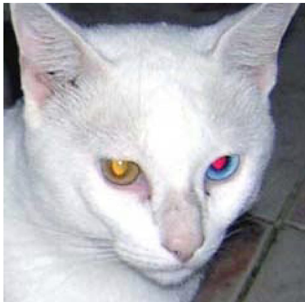
Колер свячэння зрэнак залежыць ад колеру вясёлкавай абалонкі і абумоўлены рознай ступенню пігментацыі тапетуму

цыяй вясёлкавай абалонкі. У блакітнавокіх катой (гэтак жа, як і ў сабак), незалежна ад колеру поўсці, тапетум пігментаваны слаба, і іх зрэнка адсвятляюць чырвоным колерам і меней ярка - як у чалавека (tapetum nigrum). Гэта дазваляе выказаць здагадку, што начны зрок блакітнавокіх катой такі ж слабы, як у чалавека. Каціныя нараджаюцца блакітнавокімі, гэта значыць са слаба пігментаванай вясёлкай і, адпаведна, са слаба пігментаваным тапетумам. Прыкладна да 3-месячнага ўзросту, калі ў жаўтавокіх і зялёнавокіх катой вясёлка насычаецца пігментам, пігментуецца і тапетум. Адценне свячэння зрэнак таксама залежыць ад кута падзення святла, бо пігментацыя тапетума змяняецца па кірунку ад задняй сценкі вочнага яблыка да перадняй, і яго адценне змя-