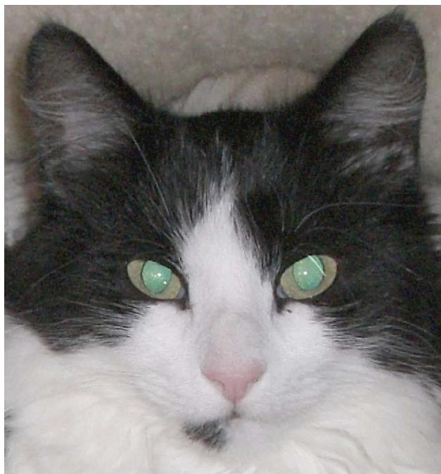
Вочы свойскага ката: тапетум адсвечвае зялёным святлом

Пігментацыя тапетуму цесна злучана з пігмента-