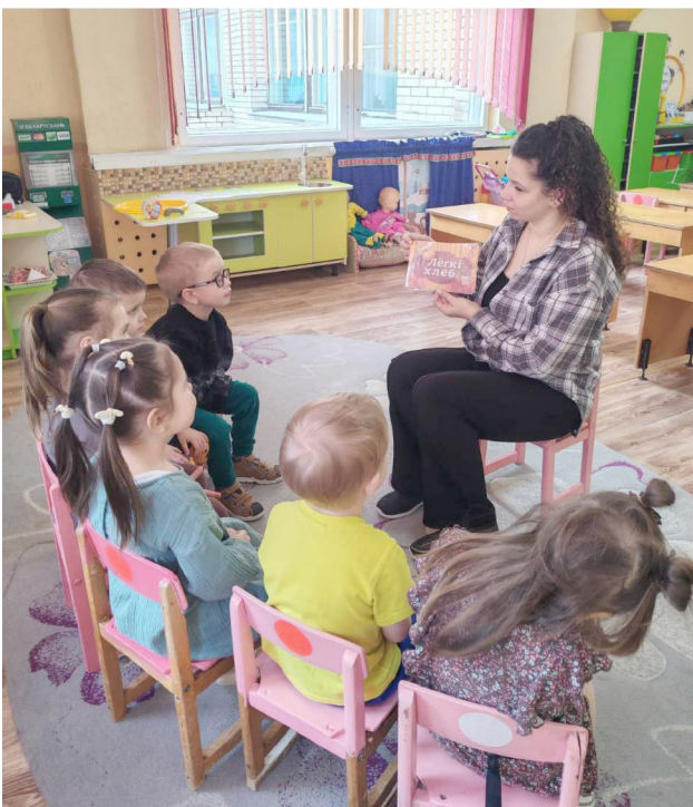
ТК "Адукацыя Лідчыны".