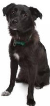
Балгарская аўчарка Не прызнана МКФ. Балгарыя