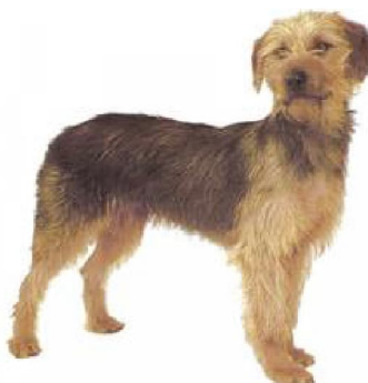
Балгарскі барак Не прызнаны МКФ. Балгарыя