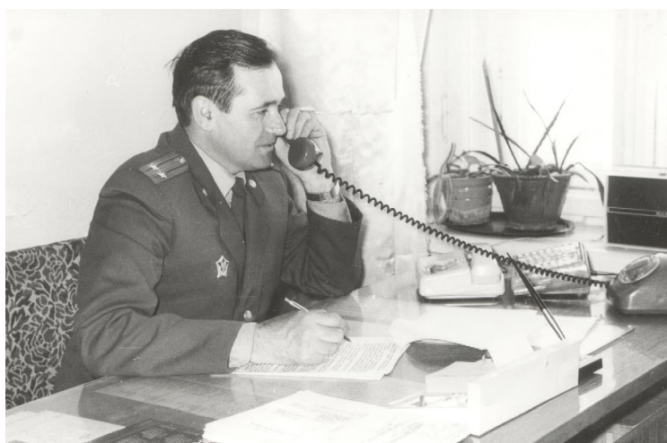
У працоўным кабінце, 1990 г