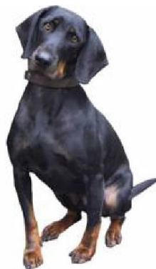
Балгарскі ганчак Не прызнаны МКФ. Балгарыя