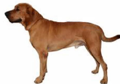
Брахольмер ці датскі масціф

1 - Сабакі-пастухі і быдлагонныя сабакі, акрамя швейцарскіх быдлагонных сабак. Вялікабрытанія