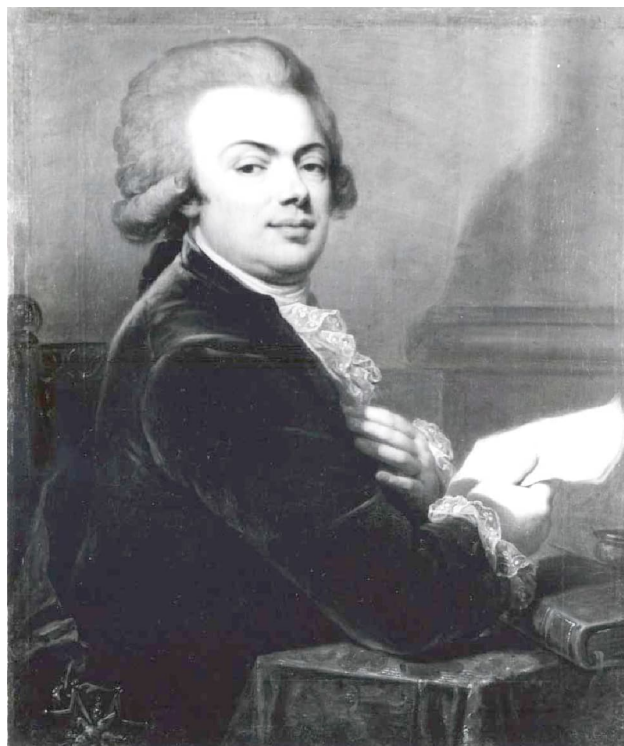
Гетман Людвік Тышкевіч

Скуміны-Тышкевічы старажытны беларускі род з XVI ст. сцісла злучаны з Лідчынай.