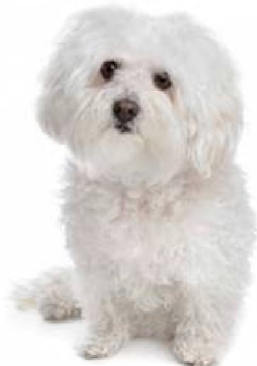
Балан'ез 9 - Дэкаратыўныя і сабакі-кампаньёны. Італія