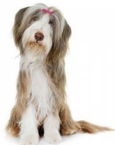
Барадаты колі 1 - Сабакі-пастухі і быдлагонныя сабакі, акрамя швейцарскіх быдлагонных сабак. Шатландыя