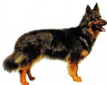
Багемская аўчарка, ці чэшскі сабака-пастух Не прызнаны МКФ. Чэхія