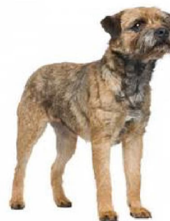
Бордэр-тэр'ер 3 - Тэр'еры. Вялікабрытанія