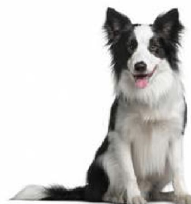
Бордэр-колі 1 - Сабакі-пастухі і быдлагонныя сабакі, акрамя швейцарскіх быдлагонных сабак. Вялікабрытанія