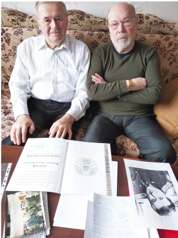
З аўтарам нарыса ў сваёй кватэры ў Мінску, 2021 г.

дамовіўся з былымі супрацоўнікамі 105-й лабараторыі, якія шчыравалі ўжо на прадпрыемстве "Аларм", на распрацоўку серыі прыбораў аб'ектавага ўзроўню, якія падыходзілі як для існуючых пультоў, так і для "Алесі". Выкарыстоўваць іх шырока ён пачаў ужо на пасадзе намесніка начальніка аб'яднання "Ахова", якое ўзначаліў будучы намеснік міністра ўнутраных спраў Аляксандр Шчурко. Пры ім у Ленінскім (г. Брэста) аддзеле ўсталявалі 15 кастрычніка 1995-га першую "Алесю". Нездзе праз год у тым жа Брэсце пад пачатам Ліпеня яе задзейнічалі для кантролю за аўтатранспартам нарадаў міліцыі. З вясны 2002-га на машынах можна было заўважыць геральдычны сімвал службы - залацістую саву, якая трымае ў сваім дзьобе ключ ад замкаў аб'ектаў і ад якой адыходзяць радыёхвалі. Зрабіць сімваліку ў такім выглядзе прапанаваў пры яе абмеркаванні, зноў-такі, Валянцін Ліпень Ён беражліва захоўвае патэнт № 3276 на вынаходства галоўнага на сёння здабытку службы аховы - аўтаматызаванай сістэмы "Алеся".