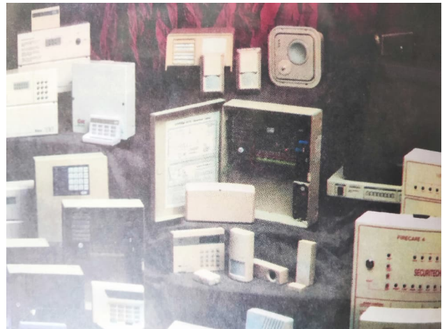
Папярэднікі "Алесі" і прыёмна-кантрольныя прыборы ў аўтаматызаванай сістэме ў музеі ДА МУС, 2026 г.