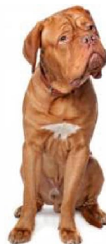
Бардоскі дог (французскі масціф) 2 - Пінчары і шнаўцары, малосы, горныя і швейцарскія быдлагонныя сабакі. Францыя