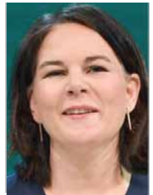
лавека ў гэтай краіне. "Увага да барацьбы за волю апазіцыі ў Беларусі не павінна слабець", - упэўнена Бербок.

Бербок з партыі "Зялёных" таксама неаднаразова заклікала ЕС не забываць пра сітуацыю з правамі ча-