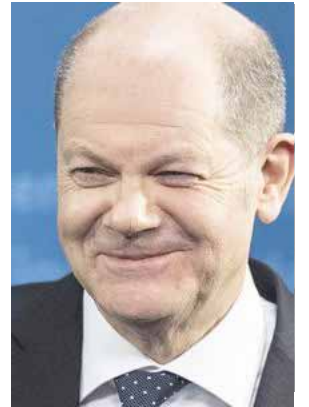
ксандра Лукашэнка ў жніўні 2020 года, заклікаўшы апазіцыю да адстаўкі і назваўшы яго "жудасным дыктатарам".

Сацыял-дэмакрат Шольц публічна выказаўся пра Беларусь на хвалі пратэстаў апазіцыі супраць Аля-