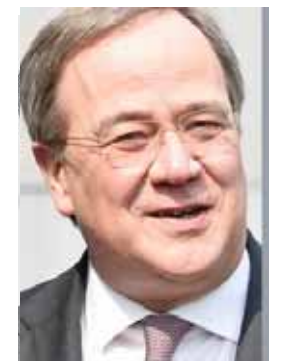
Армін Лашэт публічна стараецца абыходзіць увагай сітуацыю ў Беларусі.

На гэтым фоне кідаецца ў вочы "гучнае" маўчанне трэцяга кандыдата: